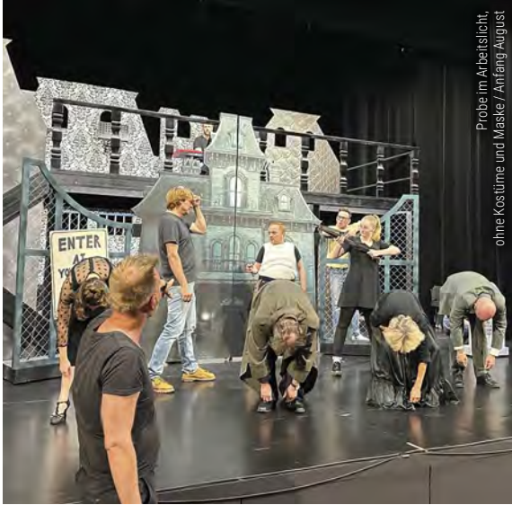
Probe im Arbeitslicht, ohne Kostüme und Maske / Anfang August

*In Kooperation mit dem Tanzstudio Let's Dance Wilhelmshaven