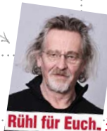
Rühl für Euch:

TheOs / 19.00 Uhr / geschlossene Veranstaltung compagnia t präsentiert Bis zum letzten Augenblick Festprogramm zum 25-jährigen Jubiläum des ambulanten Hospizdienstes